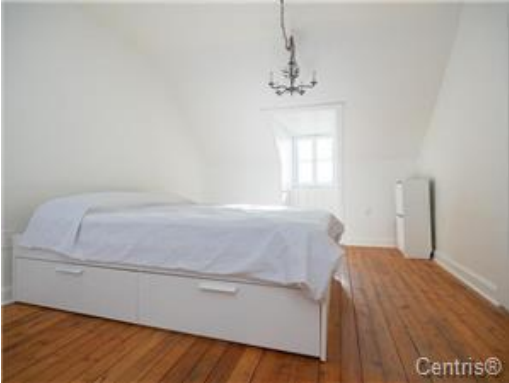
Chambre à coucher principale