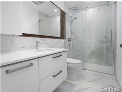
Salle de bains attenante à la CCP